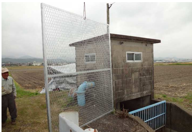
浜東部 スクリーン取替 R2.11.25