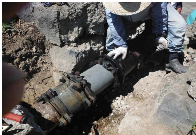
浜干拓 送水管補修 R2.8.16