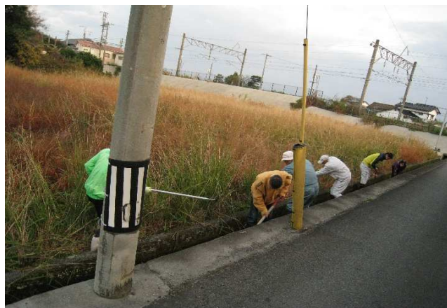
八宿 水路の泥上げ R2.11.22