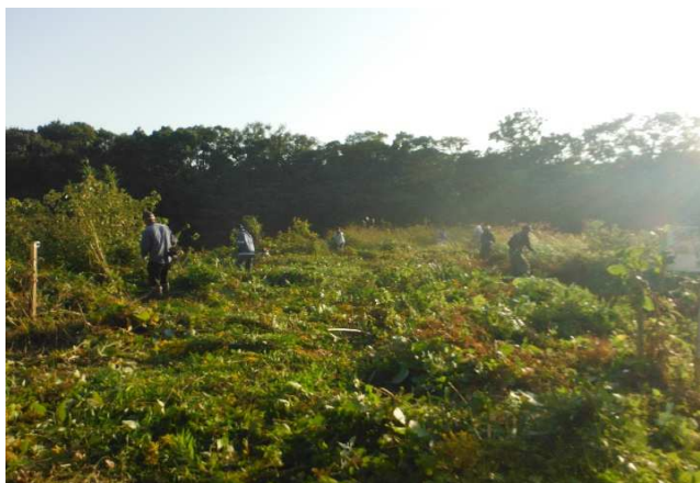
野畠 ため池の草刈り R2.11.1