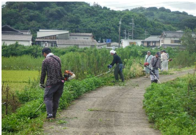
新方 農道の草刈り R2.9.13