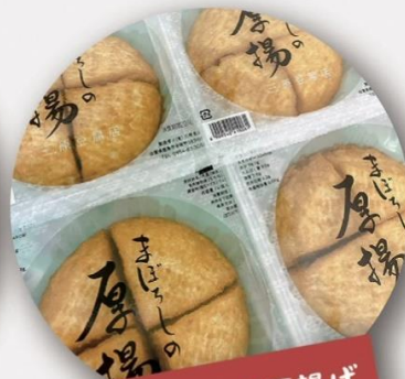
まぼろしの厚揚げ