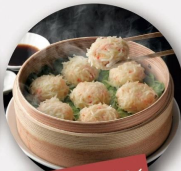
イカ・カニシュウマイ