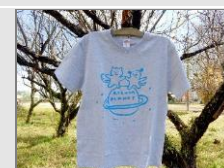
寄附金額10,000円 猫Tシャツ