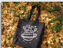
寄附金額10,000円 猫バック 黒