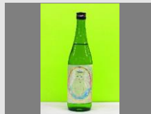
寄附金額10,000円 幸猫限定酒+ラムサール米