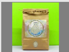
寄附金額5,000円 ラムサール米 2kg