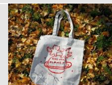
寄附金額10,000円 猫バック 白