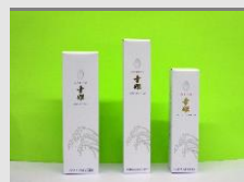
寄附金額10,000円 幸姫 化粧品 いずれか1つ