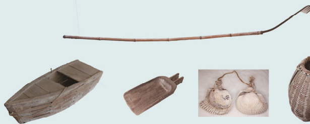
「スボカキ」「フネ」「ダンベ」「タコ壺」「カクメゴ」