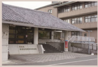
嬉野市歴史民俗資料館 (嬉野市塩田町大字馬場下 甲 1782 番地)

嬉野市歴史民俗資料館、太良町歴史民俗資料館で同時期に同じテーマの企画展示を行っています。鹿島市干潟交流館「なな海」では本物の干潟と有明海の生き物を見ることができます。