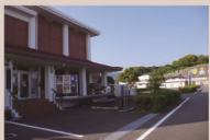
太良町歴史民俗資料館 (太良町大字多良 1 番地 11)