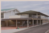
鹿島市干潟交流館「なな海」 (鹿島市大字音成甲 4427 番地 5)