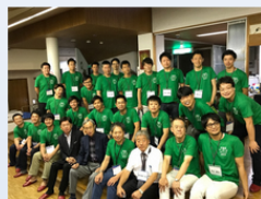
2017年度 滋賀県高島市