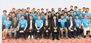
2018年度 三重県志摩市