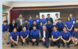
2024年度 佐賀県鹿島市