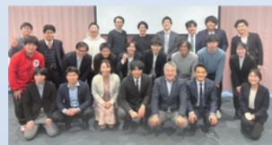
2021年度 福島県須賀川市