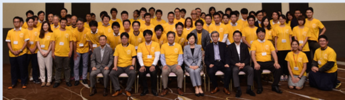
2019年度 山口県宇部市