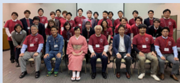
2020年度 福島県東白川郡棚倉町