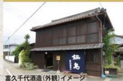
富久千代酒造（外観）イメージ