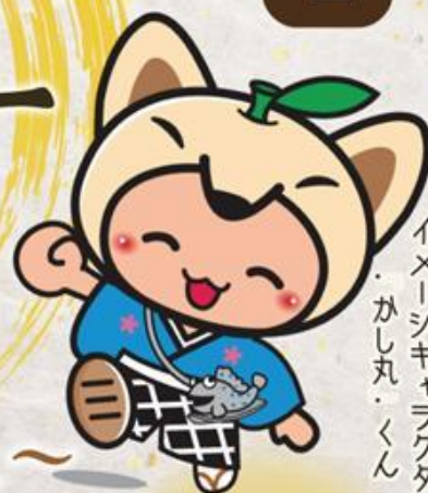
鹿島市 イメージキャラクター ・かし丸くん