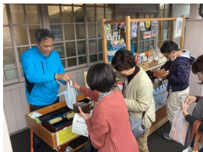
おもてなしのイメージ