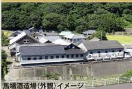
馬場酒造場（外観）イメージ