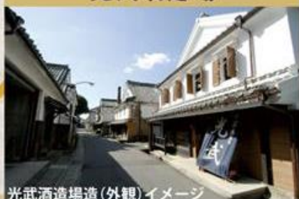
光武酒造場（外観）イメージ