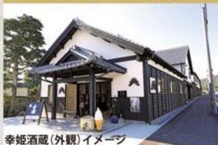
幸姫酒蔵（外観）イメージ