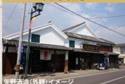
矢野酒造（外観）イメージ