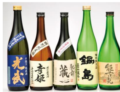
鹿島の日本酒イメージ