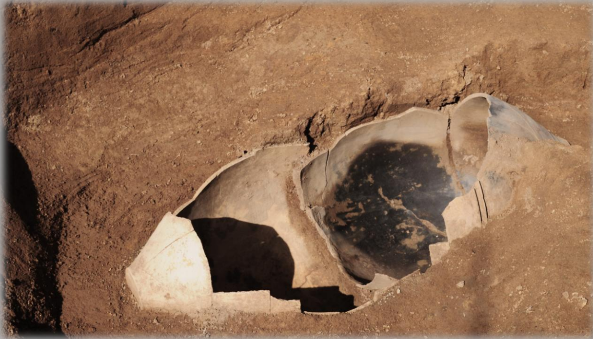
↑ 今回発見された弥生時代の「かめ棺」。弥生時代中期（およそ2,000年前）のものと考えられる。（鹿島市文化財担当）