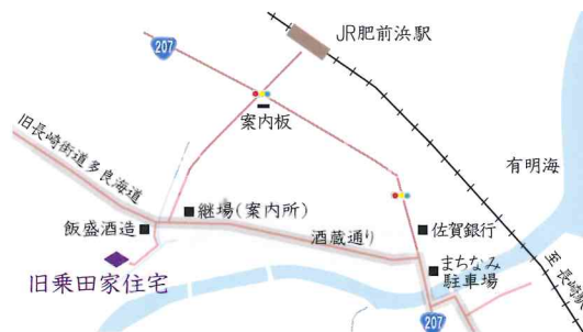
重要伝統的建造物群保存地区